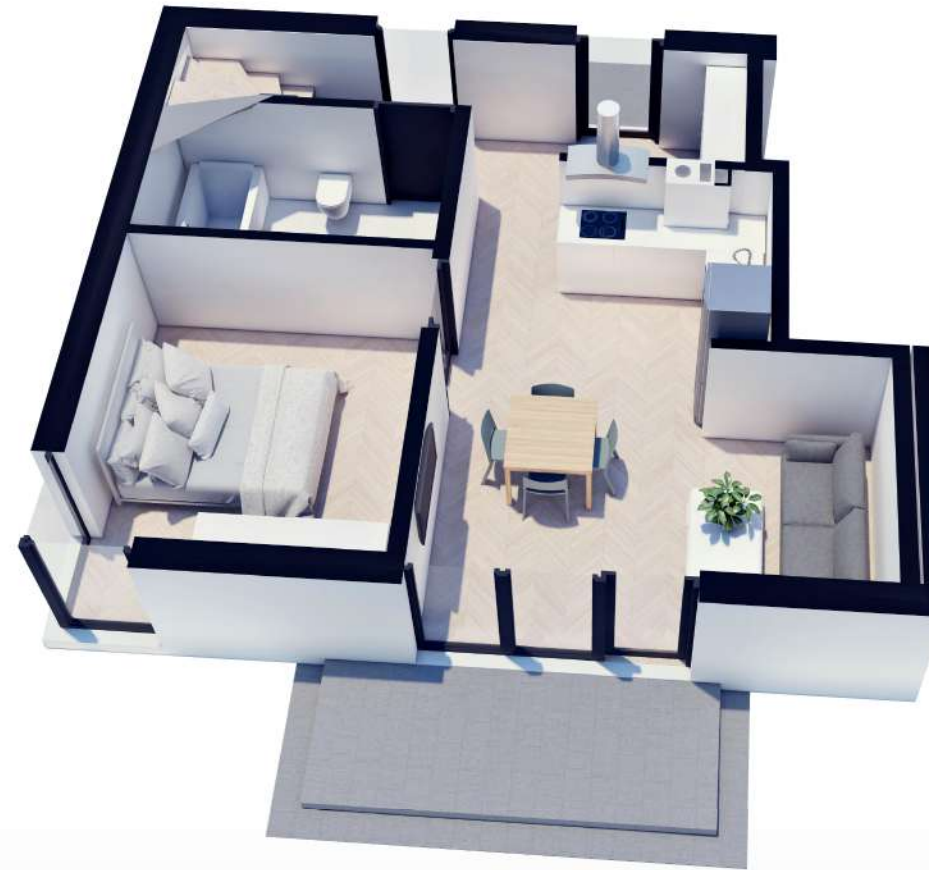
RZUT 1. PIĘTRA